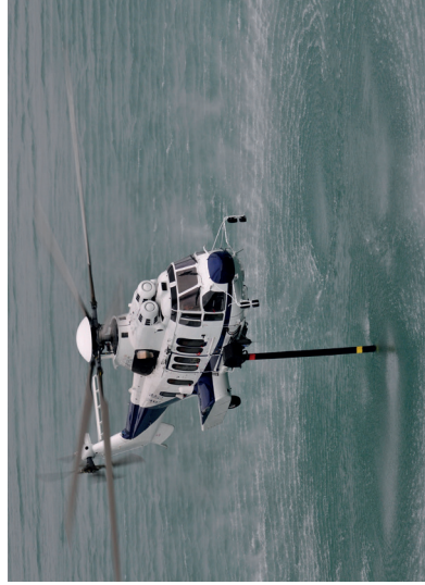
KIT BOMBA DE ÁGUA