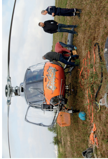
CANHÃO DE ÁGUA